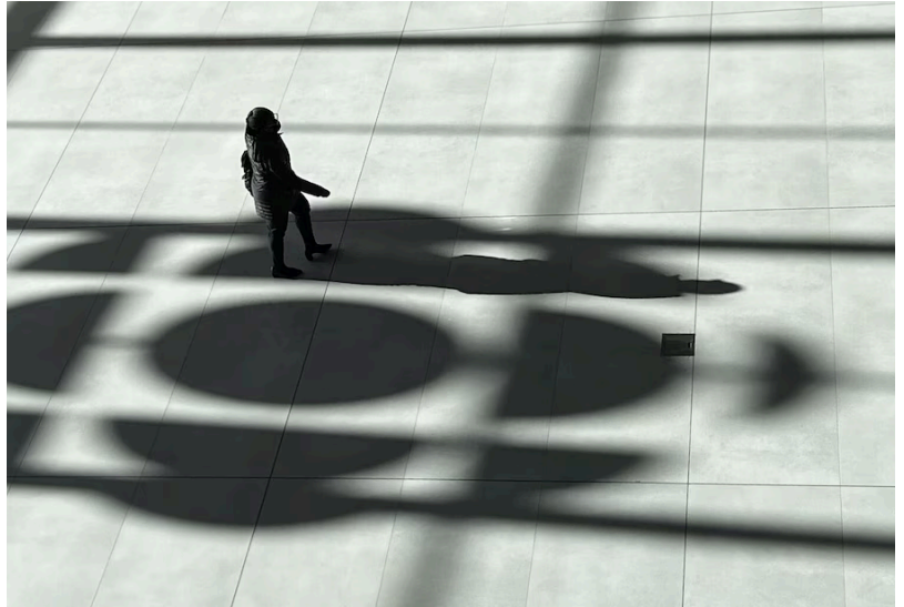
La Maison de Radio-Canada, à Montréal

Dans le cadre de leur règlement, l'AAQ, Corporation Waskahegen, Habitat Métis du Nord et Radio-Canada entendent préciser les faits qui suivent.