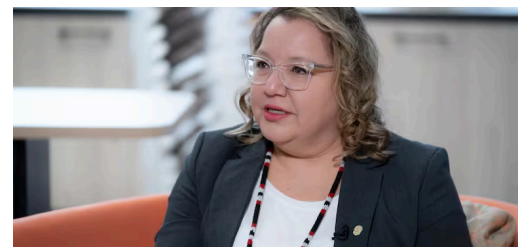
La cheffe nationale de l'Assemblée des Premières Nations, Cindy Woodhouse Nepinak

“Je sais qu'aucune somme d'argent ne peut leur rendre leur enfance, mais au moins c'est un signal pour eux qu'ils ont été lésés et qu'ils peuvent commencer le processus de guérison”. Une citation de La cheffe nationale de l'APN, Cindy Woodhouse